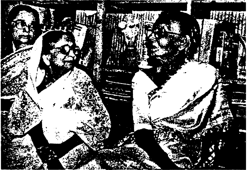
বিপ্লবী ইলা মিত্র ও সুফিয়া কামাল