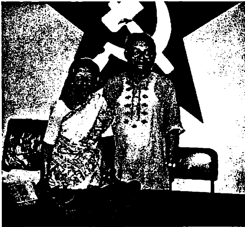
বিপ্লবী ইলা মিত্র ও কমরেড মুজাহিদুল ইসলাম সেলিম

তথ্যসূত্র: সাপ্তাহিক একতা, ২২ নভেম্বর ২০০২, বাংলাদেশের কমিউনিস্ট পার্টির (সিপিবি) মুখপত্র।